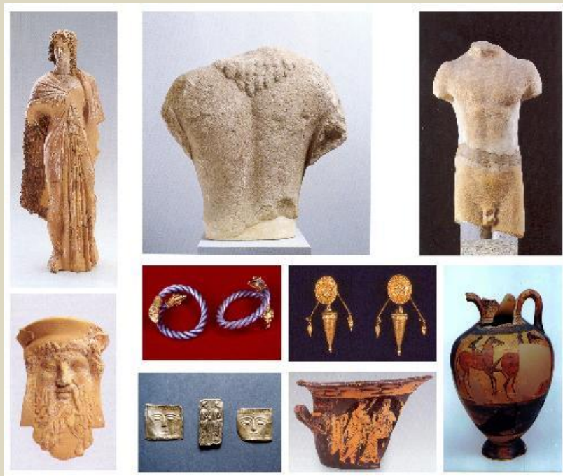
Πάνω: ευρήματα από την αρχαία Ζώνη. Κάτω: το κτίριο με τους αμφορείς.