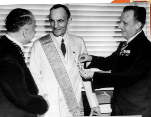
Γερμανοί διπλωμάτες απονέμουν στον Henry Ford, στο κέντρο, το υψηλότερο παράσημο της Ναζιστικής Γερμανίας για τους αλλοδαπούς, το Μεγάλο Σταυρό του Γερμανικού Αετού, Νοεμβρίου 1938

Γι’ αυτόν το σκοπό αποφασίστηκε η συγκρότηση ειδικού ταμείου, το οποίο οι παρευρισκόμενοι «προικοδότησαν» με το ιλιγγιώδες τότε ποσό των 3.000.000 μάρκων. Μαζί με αυτούς οικονομική ενίσχυση απλόχερα έδωσαν στον φασισμό δεκάδες καπιταλιστές των Ηνωμένων Πολιτειών, της Αγγλίας και της Γαλλίας (“Ford”, “General Motors”, IBM κ.α.)